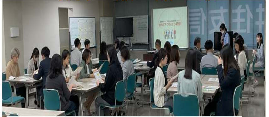
R7.10.15 三井住友信託銀行 岡崎支店にて開催